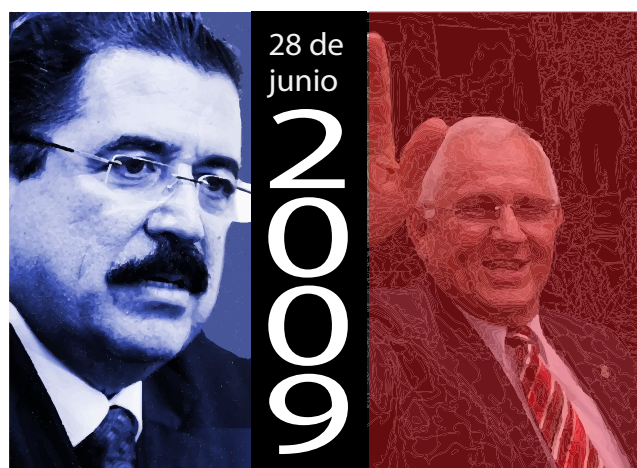
La prohibición de la PAE es una consecuencia del golpe de Estado de 2009