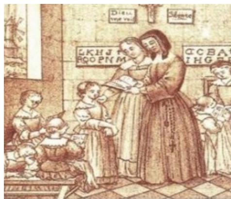
Educación femenina en el periodo colonial

Prueba de ello es un estudio realizado en el 2017, en las ciudades de Tegucigalpa, San Pedro Sula y la Ceiba, en el que se les preguntó a los feligreses de las iglesias, cristianas evangélicas y católicas; ¿Está usted de acuerdo o en desacuerdo, que la Pastilla del día siguiente debería de estar disponible en Honduras? a lo cual el 71% de las y los feligreses afirmaron estar de acuerdo con el acceso libre de las PAE. (Vasiloff, 2017)